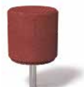
mit Bodenanker Art.-Nr. 2565000109

Der Terrasoft EPDM Zylinder findet seinen Einsatz in zahlreichen Gebieten: ob als Begrenzungselement für Einfahrten und Wege oder als Sitzgelegenheit auf öffentlichen Plätzen. Aus mehreren Zylindern entstehen einzigartige Balanceparcours sowie phantasievolle Spielkombinationen