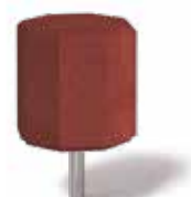
mit Bodenanker Art.-Nr. 2565000109

Das Terrasoft Polygon findet seinen Einsatz in zahlreichen Gebieten: ob als Begrenzungselement für Einfahrten und Wege oder als Sitzgelegenheit zum Beispiel an Sandkästen. Unterschiedliche Farben regen hierbei phantasievolles Spielen der Kinder an. Für noch mehr Gestaltungsvariationen ist das Polygon auch in EPDM-Farben erhältlich (siehe Seite 168).