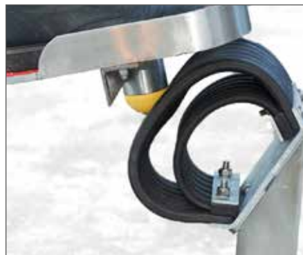
Der äußere Ring entschleunigt den ersten Aufprall der Wippe.