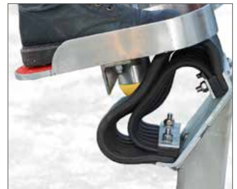
Der innere Ring sorgt für Stabilität und eine weiche Aufschlagdämpfung.