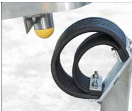
Funktionsweise des 2-Phasen-Wippendämpfers:

Der Terrasoft Wippendämpfer kann auch als stoßdämpfendes Element direkt am Wippengestell montiert werden.