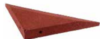
Winkelabdeckung groß - Ecke Art.-Nr. 255500xx2

Die Terrasoft Winkelabdeckung groß eignet sich im Außenbereich hervorragend zur Abdeckung von Mauern und Mauervorsprüngen sowie Bereichen, die ein Verletzungspotential durch Betonelemente beinhalten. In Ställen werden Pferde vor Kanten und vorstehenden Elementen geschützt.