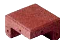
Eckelement 150 x 150 x 85 mm Art.-Nr. 251030xx1

Winkel- und Eckabdeckungen dienen im Außenbereich als äußerer optischer Abschluss von Terrassen und Balkonbelägen sowie als Mauerabdeckungen im Umfeld von Spielgeräten oder in Stallungen.