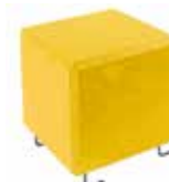
mit Bodenanker Art.-Nr. 256500109

Das Universalgenie – der Terrasoft Würfel ist Ruhepol in städtischen Bereichen oder eindrucksvolles Spielelement. Die klare, einfache Struktur und die umfangreichen Farbvarianten regen die Phantasie der Kinder an.