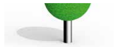
mit Bodenanker Art.-Nr. 3533501xx

Ob in Gärten oder städtischen Bereichen – die Kugel ist vielseitig einsetzbar und macht überall eine gute Figur. Gezielt eingesetzt kann sie Sitzmöglichkeit und Balanceparcours zugleich sein. Gegen Aufpreis ist die Kugel auch mit EPDM-Oberfläche erhältlich.