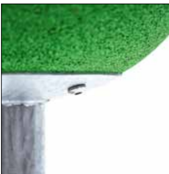
Befestigung des Terrasoft Bodenankers

Gerät während der Abbindezeit von 8 – 10 Tagen – je nach Witterung und Fundamentgröße – bis zur endgültigen Fertigstellung für die Benutzung sperren.