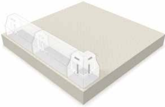
Aufstellen der Hockeybande. Verbindung der Elemente auf der Unterseite mit Hilfe des Montagesets.