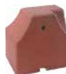
Hockeybande Eckelement Art.-Nr. 255000xx2

Die Terrasoft Hockeybande ist das Einfassungselement für Streethockeyfelder und Skate-Anlagen, denn sie eignet sich auch für Eishockey- und Eislaufbahnen, da die Spielflächen ab -10 °C geflutet werden können. Sie wird gerne auf Skateparks oder in innerstädtischen Bereichen zur temporären Installation eines Streethockeyfeldes eingesetzt.