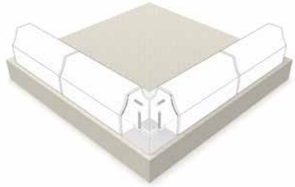
Aufstellen der Hockeybande mit Hilfe des Eckelements.