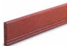
Wegefassung Artikelnr. 252000x1

Für barrierefreie Übergänge kann die Terrasoft Bordsteinrampe in den Verlegeplan integriert werden. Einfassungen werden schnell und einfach mit der Terrasoft Wegefassung gestaltet.